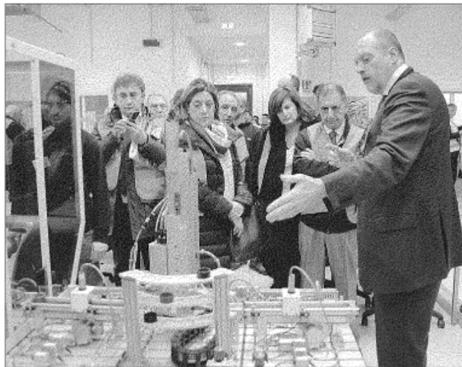
Alla Paciana Inaugurato il Labomec, l'accademia di alta specializzazione post diploma rivolta ai giovani